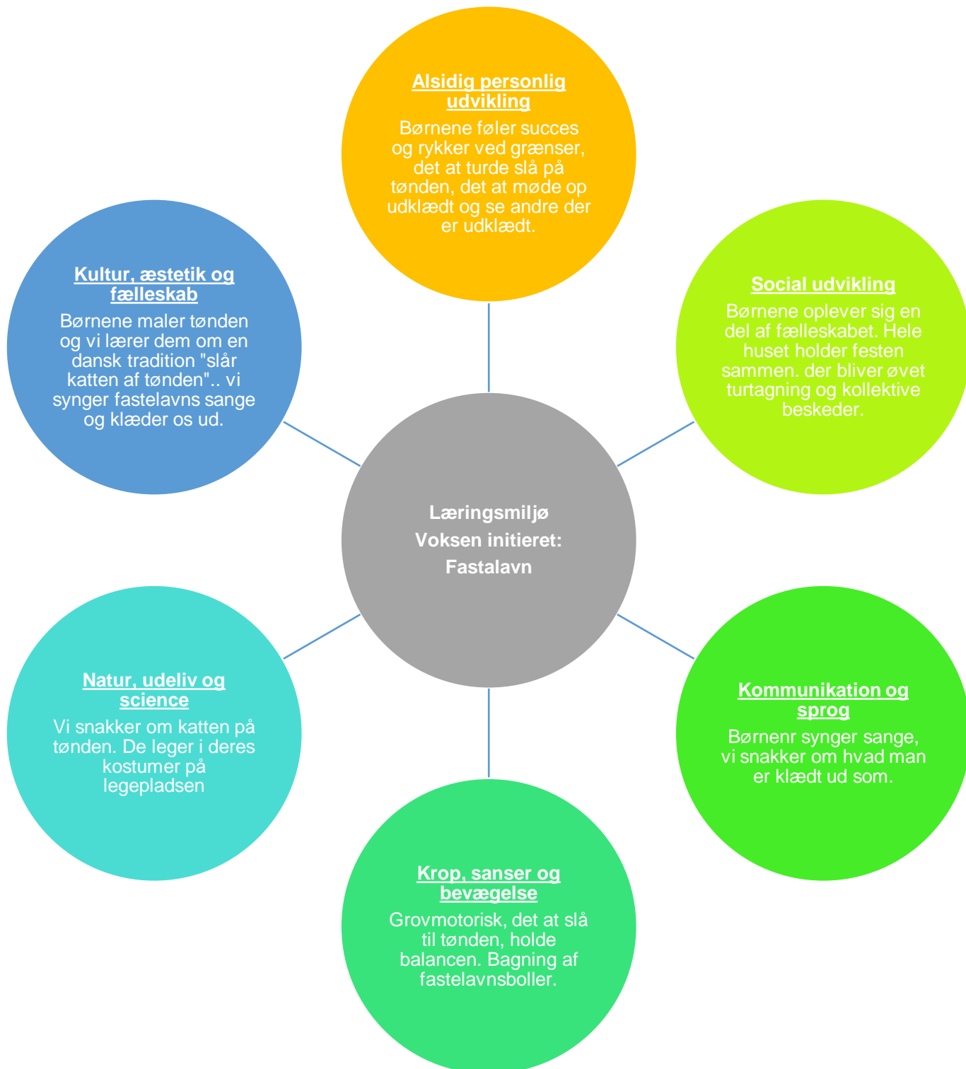
Figur 11 Læringsblomsten for børnegruppen 0 – 2 år - Kultur, æstetik og fællesskab