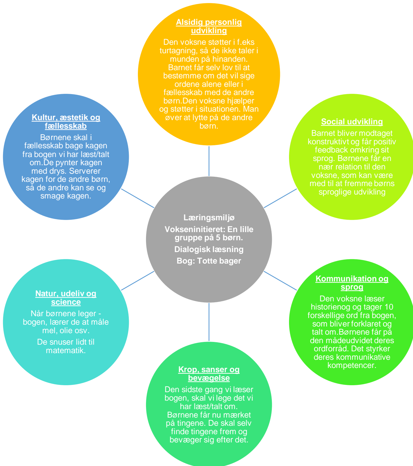
Figur 6 Læringsblomsten for børnegruppen 3 år og frem til skolestart - Kommunikation og sprog