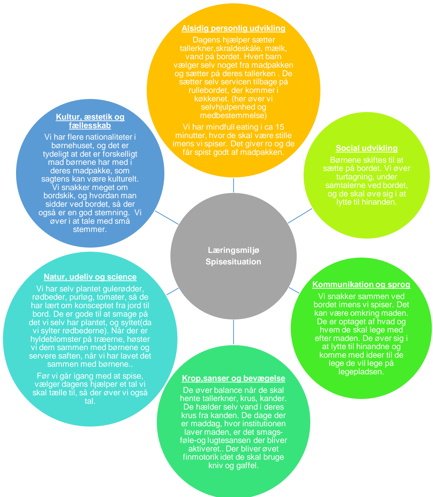
Figur 4 Læringsblomsten for børnegruppen 3 år og frem til skolestart - Social udvikling