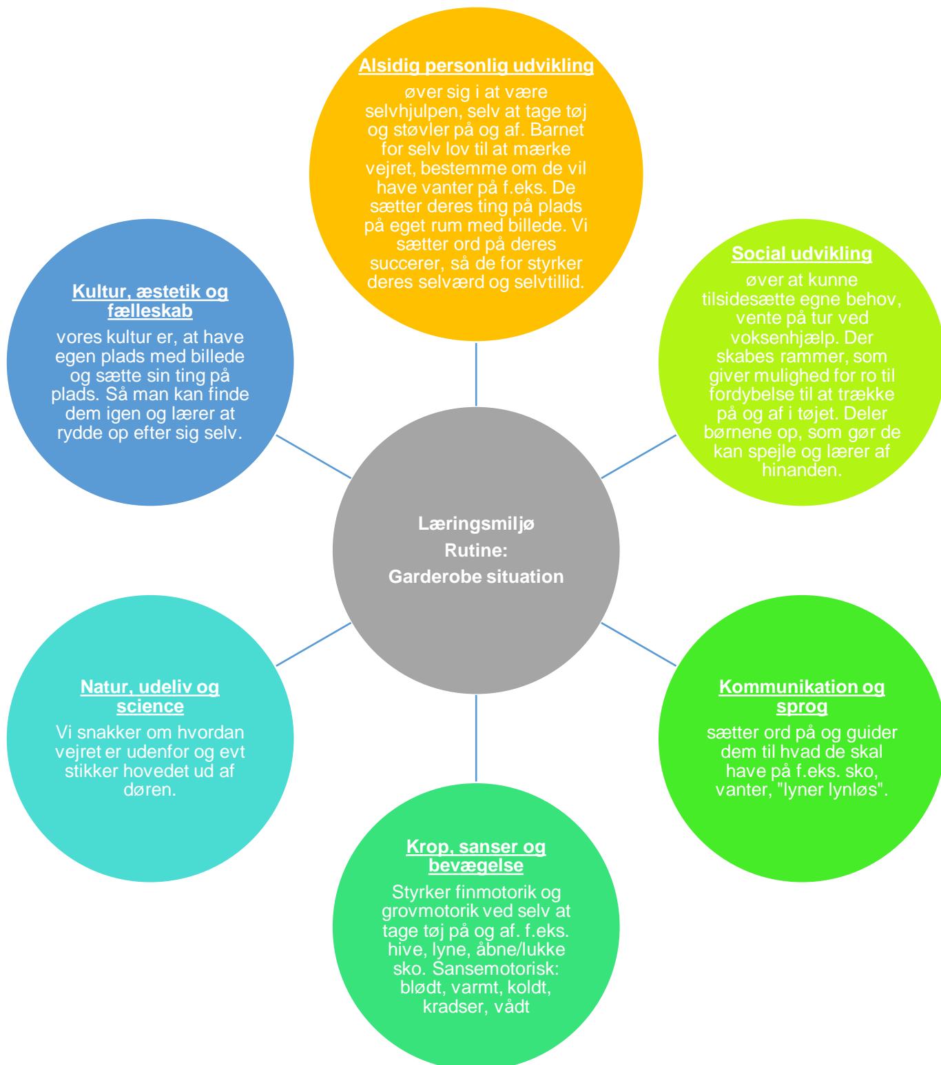
Figur 1 Læringsblomsten for børnegruppen 0 – 2 år - Alsidig personlig udvikling