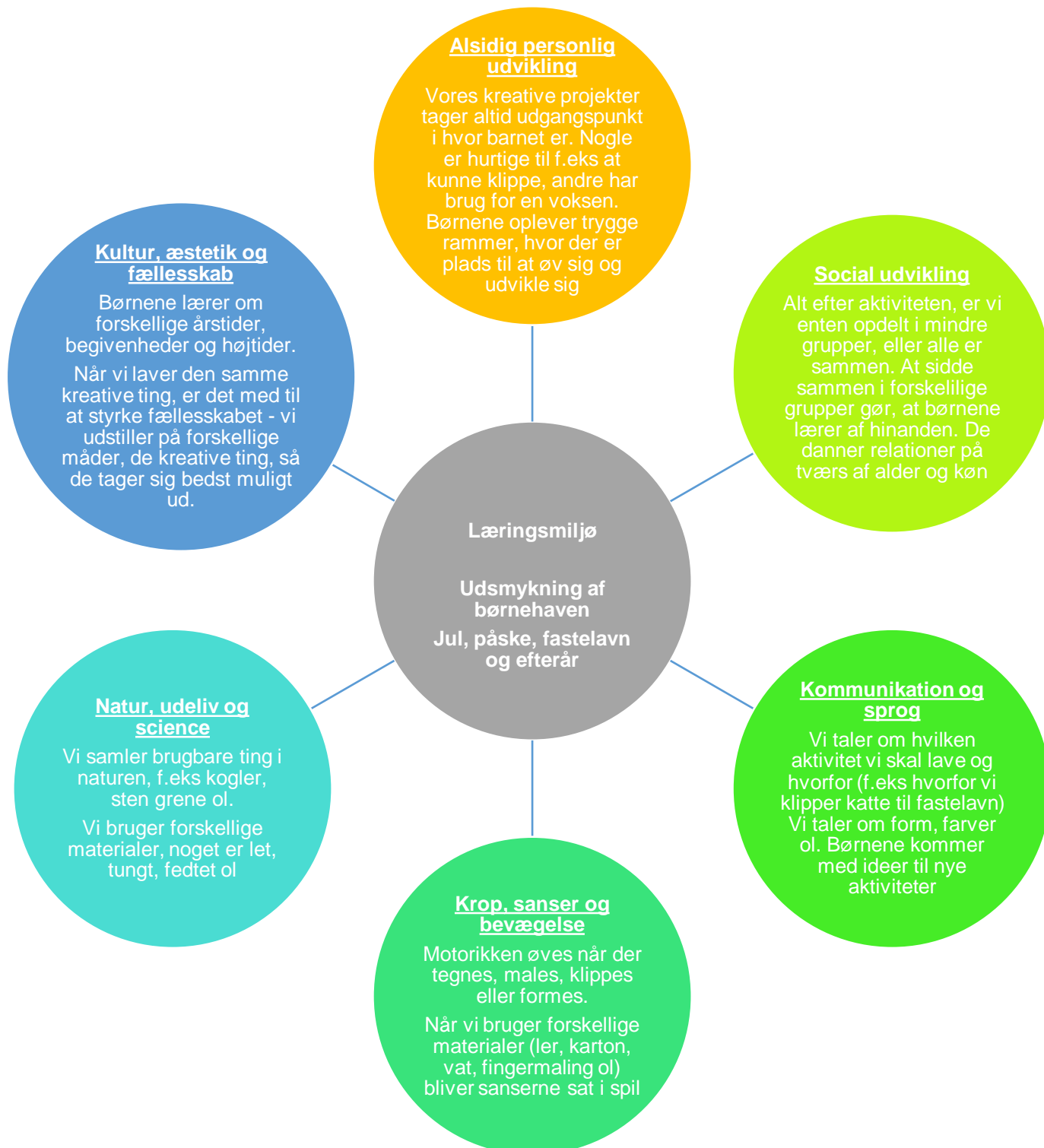
Figur 12 Læringsblomsten for børnegruppen 3 år og frem til skolestart - Kultur, æstetik og fællesskab