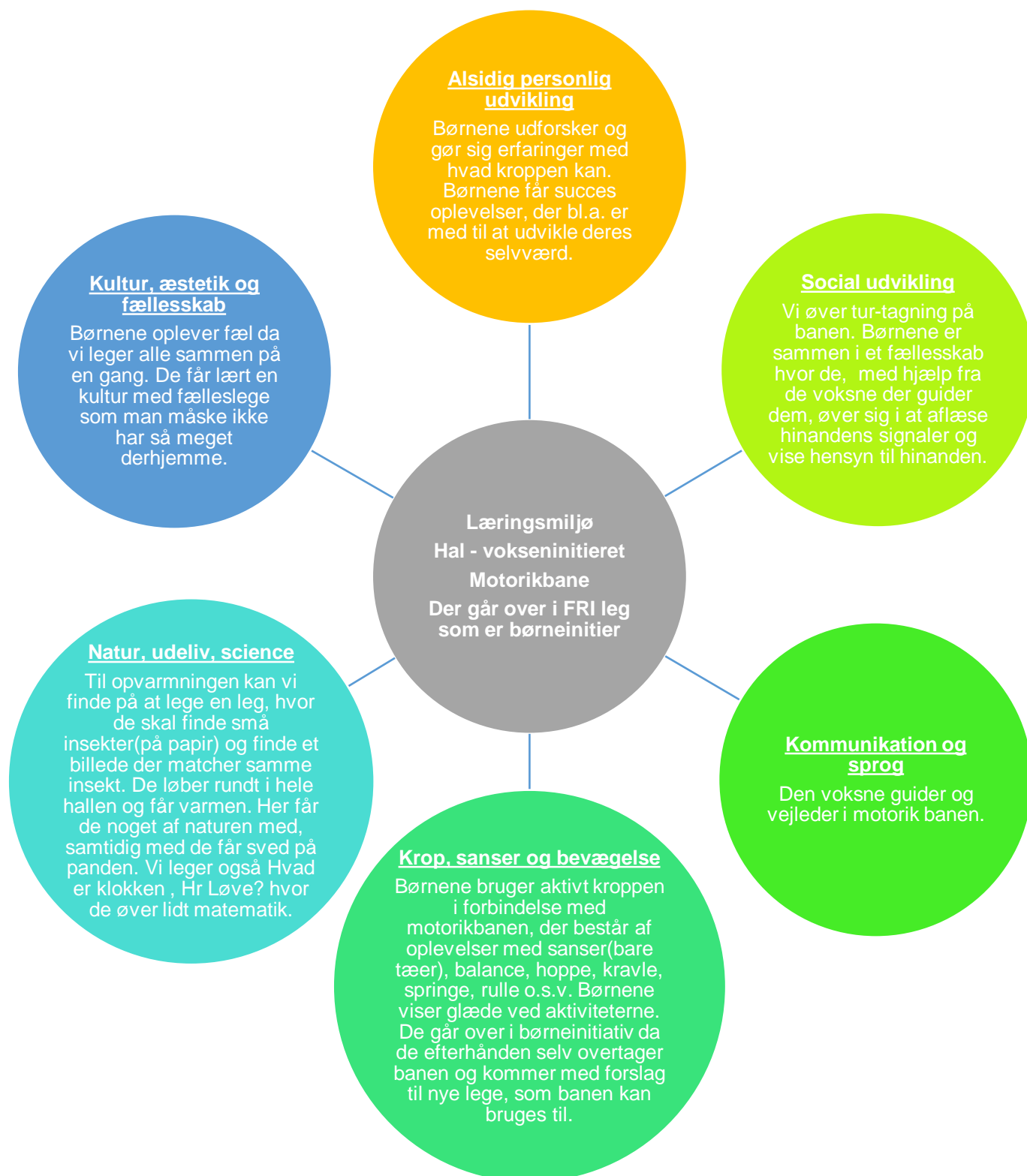
Figur 8 Læringsblomsten for børnegruppen 3 år og frem til skolestart - Krop, sanser og bevægelse